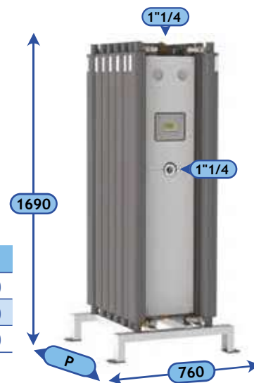
SEC 7 OX